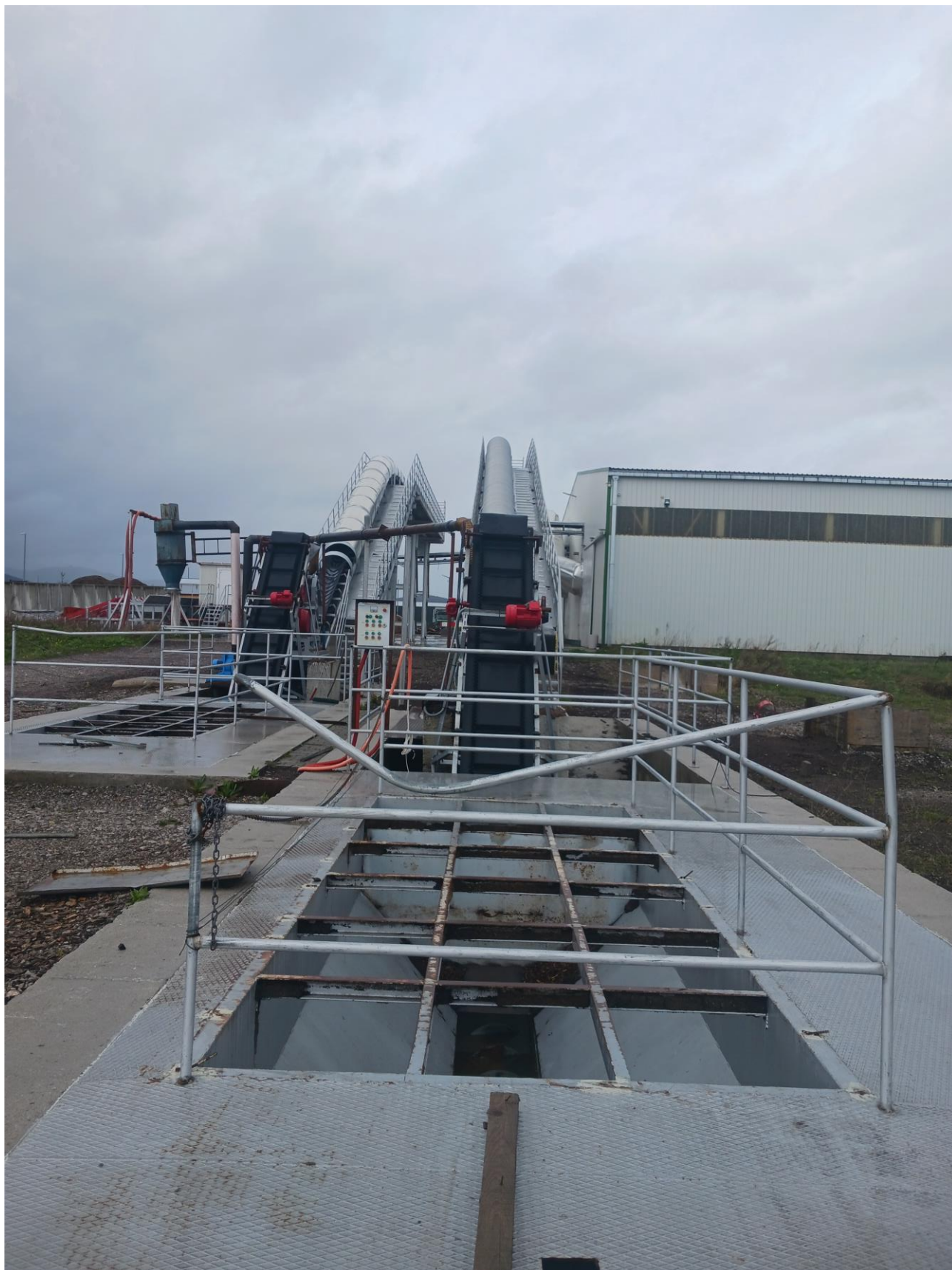
Drbilica za sječku br. 3